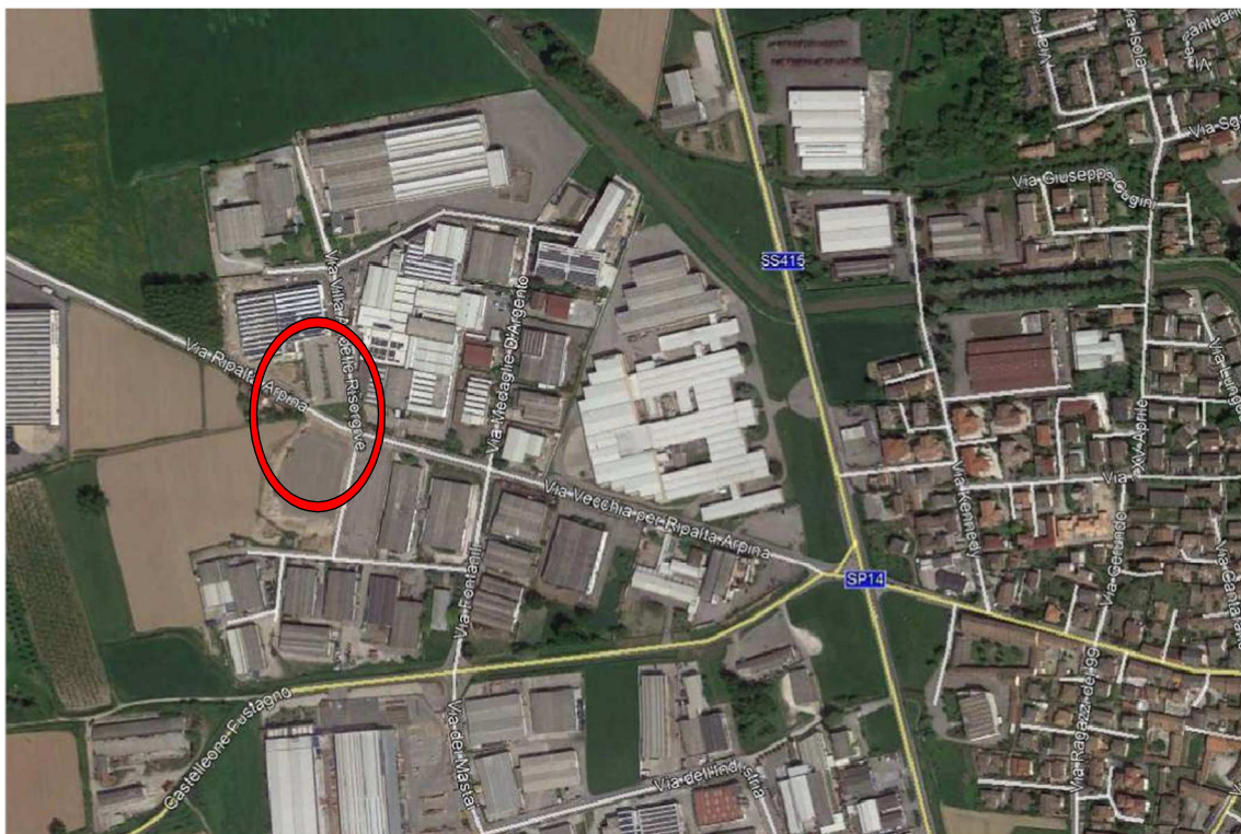
- Inquadramento dell'area interessata -